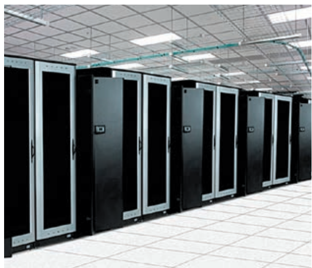
Рис. 1. Прецизионные кондиционеры в ЦОД

Первые высоконагруженные стойки поселились в ЦОД научных и военных учреждений и, казалось,