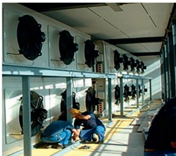
■ Рис. 2. Установка системы ВОП «холодные стены» в ЦОД Rolex, План-лез-Уат, Швейцария, 2010 год

были очень далеки от коммерческого применения. Но высокую скорость обработки данных довольно быстро по достоинству оценили банки и маркетинговые агентства, а вслед за ними и другие участники рынка. И вот уже мы, проектируя сегодня ЦОД, считаем среднюю нагрузку на стойку 10 или даже 15 кВт и понимаем, что прецизионный кондиционер больше не справляется с потребностями современного ЦОД – громоздко, дорого, неэффективно. На сегодняшний день нам уже требуется один межрядный прецизионный кондиционер на две стойки.